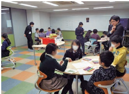
2018年入試から新設された宝仙学園理数インターのアクティブラーニング型の新入試「理数インター」

実際に出願する6校（6～8校）のなかには、必ずこの“押さえ校”を入れておきたい。どんなに力の