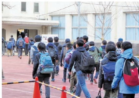
入学願書の記入にあたっては「読みやすい字でていねいに書く」ことを心がけよう（写真は麻布中の入試風景）

出願にあたって、小学校の「調査書」を必要とする学校はほとんどなくなっているが、まだ一部