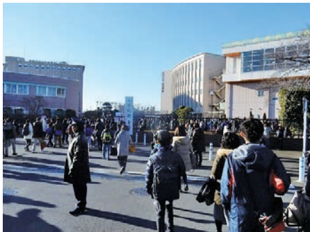
2018年入試では6千4百人以上の願者を集めて最大規模の入試となった10月の栄東中A日程の入試風景。

なかには、まだこの時期でも「歯が立たない」問題や、解法の糸口がすぐには見つけられない問題もあるかもしれない。しかし、それでも一向にかまわない。「できない」ことや「覚えていない」ことを恐れずに、まず