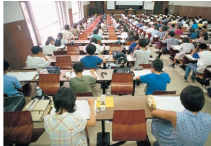
入試直前の時期にも、できるだけ「ふだんどおりの」生活をする中で、お子さんはストレスを発散できるように考えておこう（写真は模試の風景）

保護者の仕事としては、綿密な受験スケジュール表を作成し、受験結果がわかったあとの（納入金や書類などの）段取りを再確認し、必要であれば、ご家族の間でしっかりと受験に関わる役割分担をしておきたい。できれば試験会