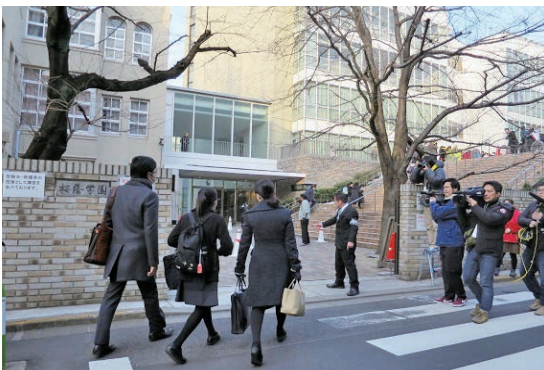
毎年2月1日に行われる桜蔭中の入試風景。気迫のある表情で訪れる受験生が多い。

最近では受験することがほぼ“常識”のようにになっている「午後入試」などは、その象徴的な存在だ。「午後入試を第1志望として受ける」受験生はほとんどいない。ほぼすべての受験生と保護者が、「わが子の第1志望校合格」のためのステッ