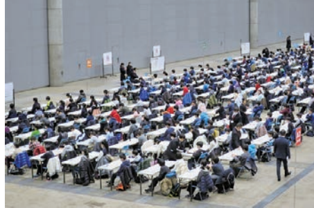
2018年入試では2800名以上の志願者が幕張メッセに集った1月の市川中（第1回）の入試風景

早くから親子でめざしてきた第1志望校については、むしろ「迷わずに（事前の入試結果がどうであろうとも）」チャレンジしていくほうが、結果が良い場合が多いということも意識しておきたい。