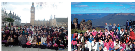
海外語学研修のラインナップも豊富！（左：イギリス語学研修、右：オーストラリア語学研修）

さらに、もっと英語の学力を伸ばしたい帰国生や国内生のために、正規の授業よりさらに高度なレベル設定の「学年オープン制のハイレベル英語講座」も、放課後の特別授業として用意されました。そして、校舎がすべて完成して余裕ができたことを期に、2016年入試からは募集定員を40名程度増やして帰国生と海外での活躍を志す英語学習歴のある国内生向けの新しい入試を導入する計画もあるといいます。いま結実しつつある“山脇ルネサンス”の改革の一環として、さらに高い「志」の実現に向けて、ますます進化しようとする山脇学園の今後がとても楽しみです。