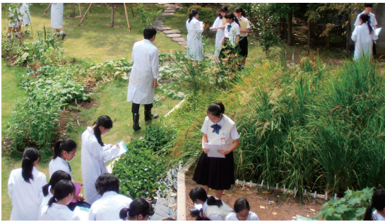
S1にある屋外実験場では四季折々の植物を育成・観察することができます。

る継続的な実験をするための設備やスペースが設けられています。理系の大学や大学院に進み、「リケ女」をめざす女子にとっては、将来の進路や職業、自身の「研究する姿」もイメージできるような施設になっています。現在の中3からは理系進学希望者が5割近くまで増えていることも納得です。