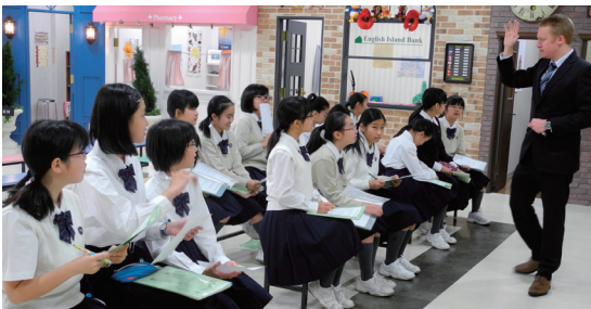
「おとぎの国？」いえいえ、イングリッシュアイランドには英語を好きになるシカケが満載です♪

現在この「イングリッシュアイランド」がある3階は、中1HR教室のある2階と、同校の「志」を実現する4つの力のひとつ「自己啓発力」を培うための「自学館」（4階）の間に位置し、まだ新鮮な気持ちで授業に臨む中学1年生には、とても人気の高い空間になっています。