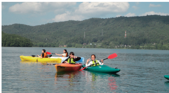
白馬での自然体験学校ではカヌーにもチャレンジ予想図。

山脇学園の「志」を育てる教育の両輪のもうひとつが、「チャレンジ精神の養成」「フィールドワーク」「協働力の養成」を三つの柱とする「校外教育」です。志を立て、それを実現するには、実体験を通して自分を取り巻く社会の理解、人との関わりのなかで仕事をする力、そして何事にも動することなくチャレンジする精神が必要だからです。たとえば中2で行われる「白馬村での自然体験学校」では、初日は一人一艇ずつのカヌー講習に始まり、野外料理、漆黒の湖に漕ぎ出すホテル観察クルーズ、キャンプ場での宿泊体験など、女子校には珍しい、野外でのちょっと“ワイルドな”チャレンジ体験をすることができます。2日目は、八方尾根から雪渓を超えて丸山ケルンをめざし、往路で