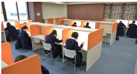
生徒たちの自発的な取り組みを演出するスペース「自学館」

2013 年 11 月には、21 世紀の理想の校舎をめざした第 1 期工事（高校 HR 教室などがある新 1 号