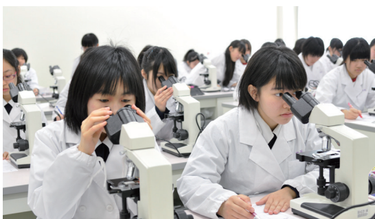
理科はちょっと苦手な女子も、S1で実験すれば、自分の中に隠れた「サイエンティスト」の才能を発見できるかも！

館）が完成。そして 2015 年 3 月には新校舎建築が完了し、来春の新入生からは、6 年間を通して真新しい恵まれた環境のキャンパスで快適に過ごせることとなります。